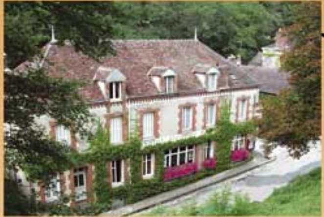
Bar – Crêperie Le George Sand