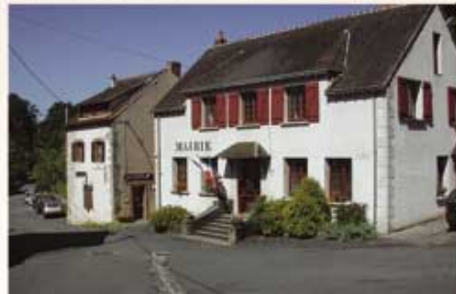
Mairie – Salle du conseil Expositions