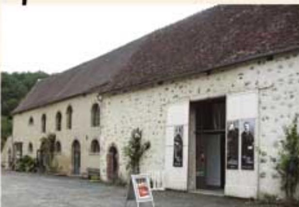
Ferme du château