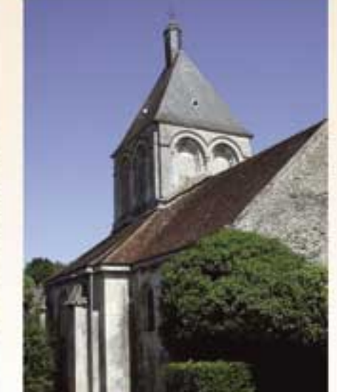
Eglise du XIIe s. Crypte