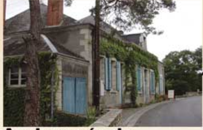
Ancienne école Expositions (*)