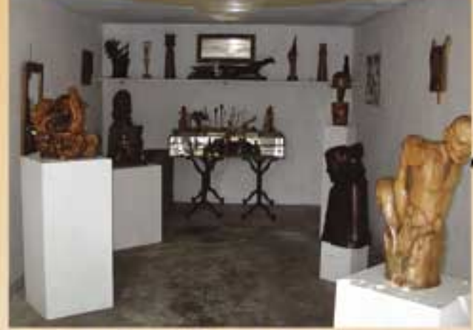
Sculpture sur bois Bonithon