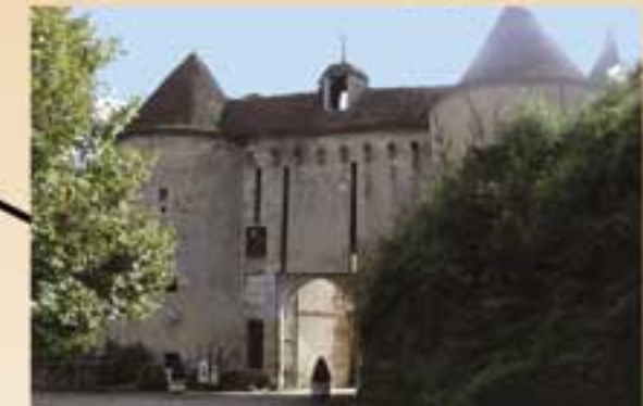
Château de Gargillesse Expositions (*)