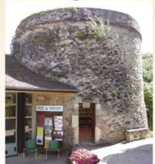
Office du tourisme Le Pigeonnier