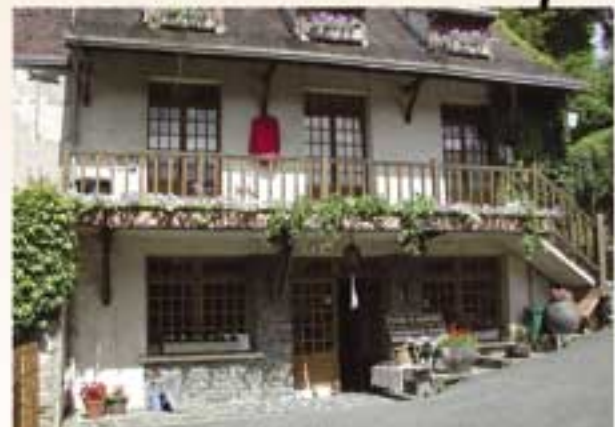
Productions artisanales Baudat