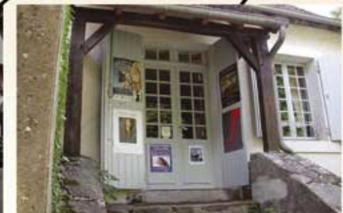
Maison de George Sand dite Villa Algira