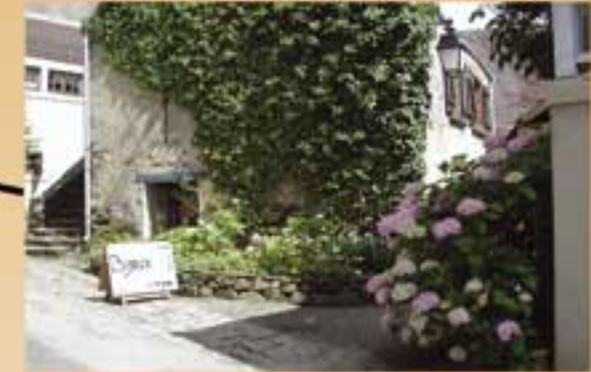
Maison d'Annette Expositions (*)