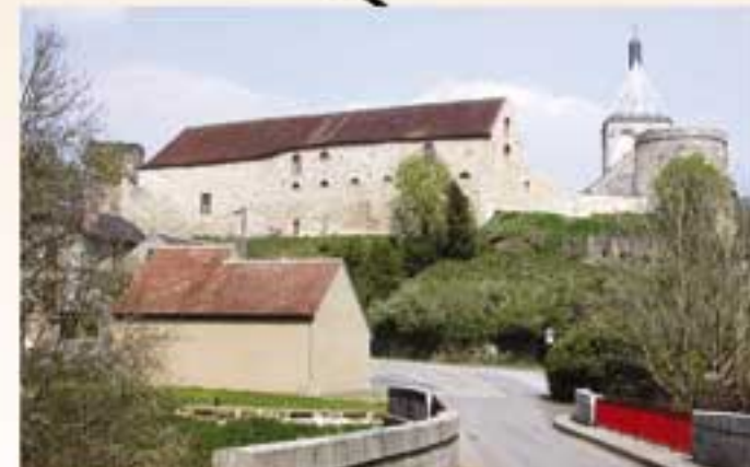
Vue depuis le pont rouge